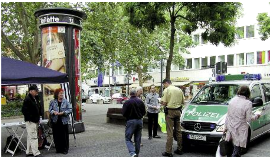
Polizeikontrolle am Infostand von „Leben in Stuttgart“ hinter dem Rathaus am 21. 06. 2008

Bitte geben Sie als Verwendungszweck Spende und, sofern Sie eine Zuwendungsbestätigung brauchen, Ihre vollständige Anschrift an.